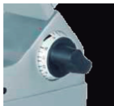
Pomo regulador de corte de 0 - 24 mm