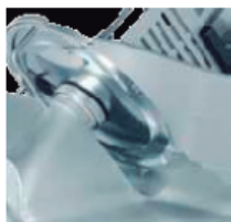
Libre acceso a todas las partes de la máquina para una fácil limpieza