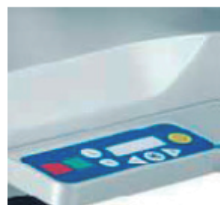
Terminal con teclado a prueba de goteo